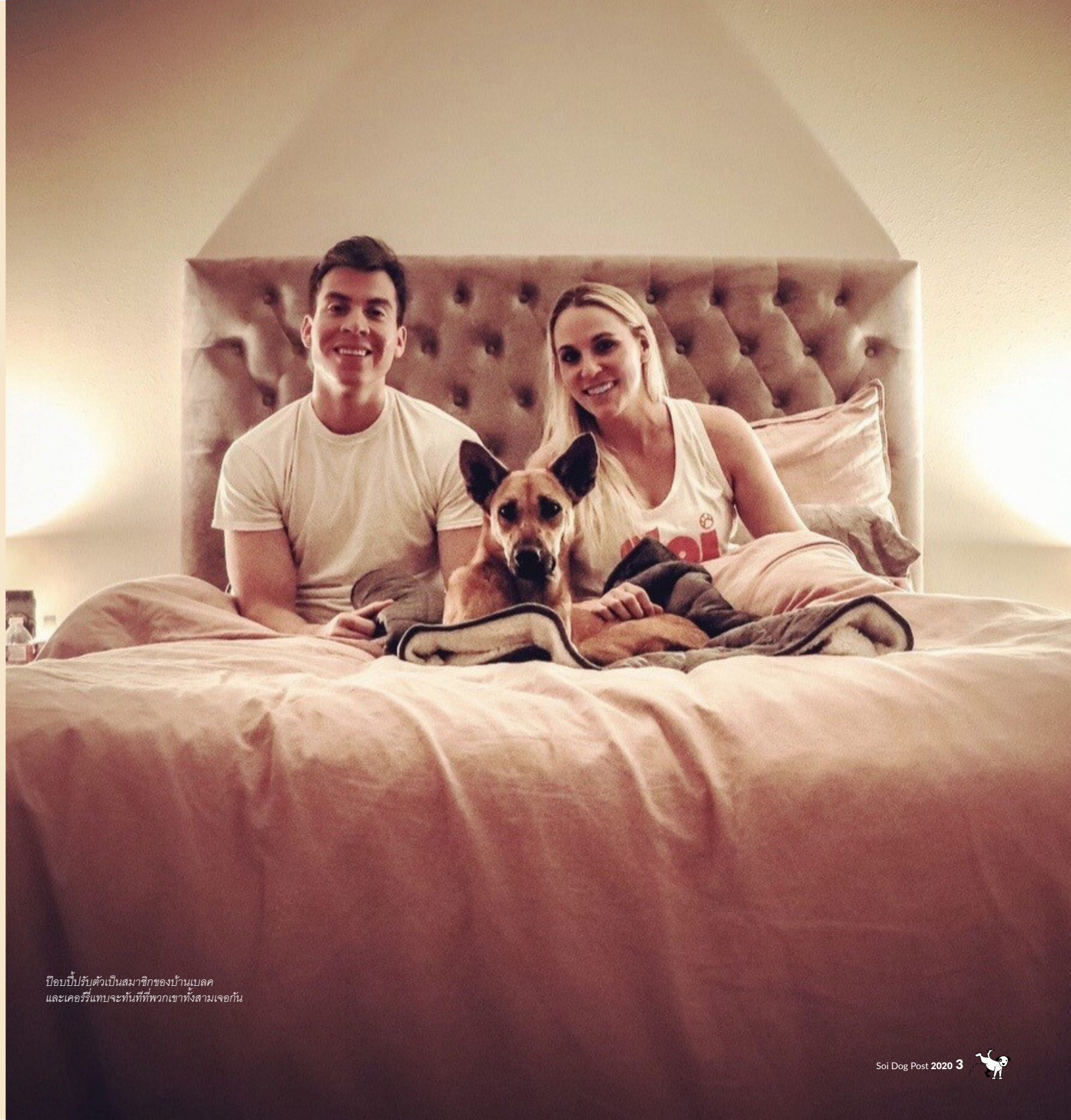
ป๊อบบี้ปรับตัวเป็นสมาชิกของบ้านเบลค และเคอร์รี่แทบจะทันทีที่พวกเขาทั้งสามเจอกัน

ฉันรับอุปการะเจ้าขวัญใจ สุนัขตัวแรกจากซอยตึกมาเมื่อกรกฎาคม 2559 ในตอนนั้นที่เลือกขวัญใจก็เพราะด้วยความเป็นสุนัขแก่อายุ 19 ปีที่อยู่ในช่วงบั้นปลายของชีวิต และก็ยังมึนงงไม่แข็งแรงนักกับขาสามขาและตาเพียงข้างเดียว ประกอบกับสภาพจิตใจที่ดูแย่และหวาดกลัว ฉันซึ่งในขณะนั้นกำลังเผชิญกับช่วงเวลาที่ยากลำบากของชีวิตและรู้สึกในตอนนั้นเลยว่าถ้าฉันช่วยชีวิตสุนัขสักตัวที่อยู่ในสภาพแย่ไม่ต่างจากตัวฉัน เราจะสามารถช่วยกันและกันได้ และเจ้าขวัญใจก็กลายเป็นเพื่อนที่ดีที่สุดของฉัน มันใช้เวลาร่วมกันกับฉันแค่เพียงสามปีสั้นๆ แต่ช่วงเป็นช่วงเวลาที่มีความหมายเหลือเกิน ถึงแม้ว่าช่วงเวลาที่กำลังจะจากไปเจ้าหมาตัวนี้จะยังคงทุกข์ทรมานจากอาการ PTSD หรือความเครียดรุนแรงจากการเจอเรื่องเลวร้ายในชีวิต ขวัญใจก็ลาโลกไปท่ามกลางความรักที่ไม่มีเงื่อนไขจากฉันและความสุขเท่าที่หมาตัวหนึ่งจะมีได้