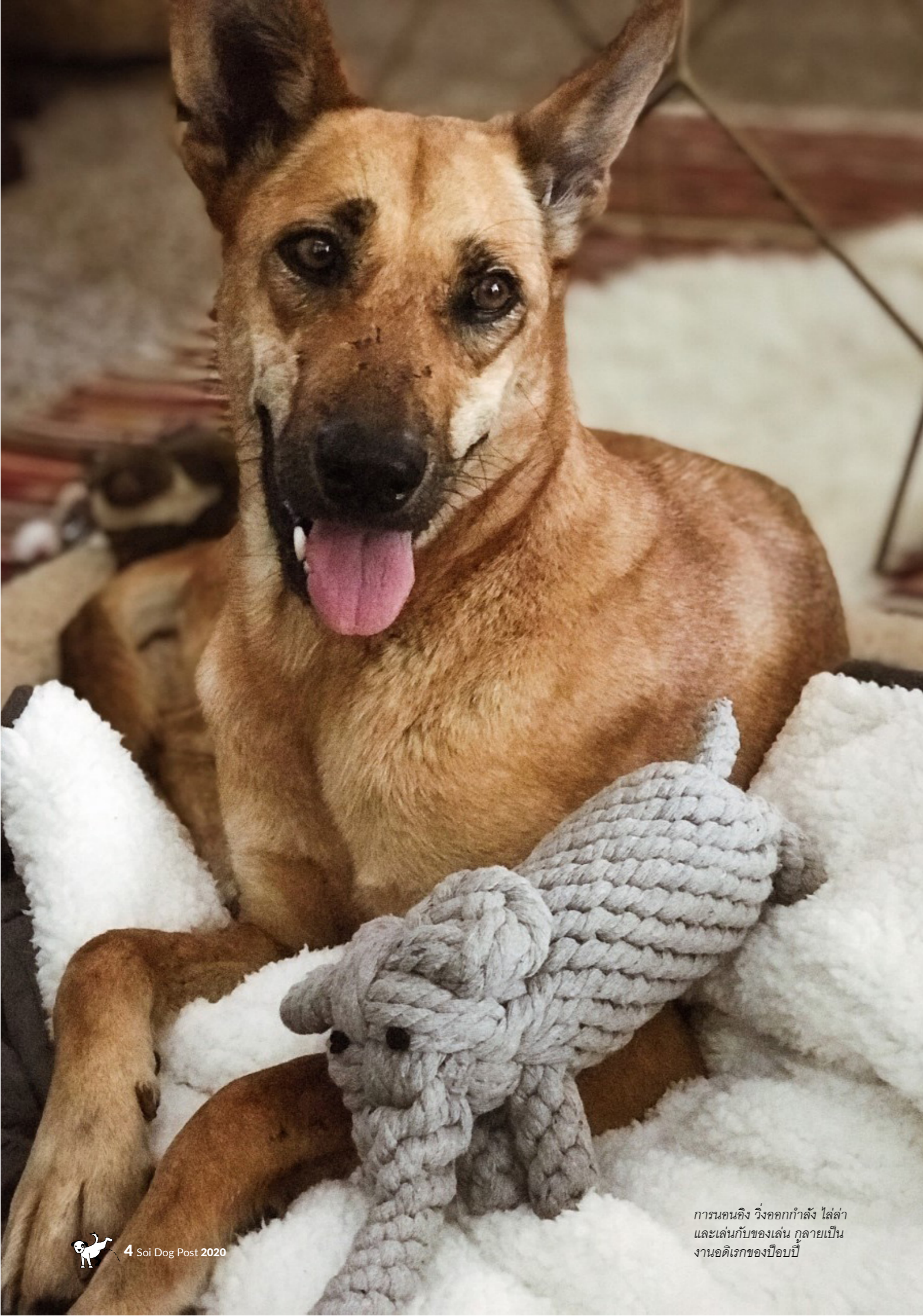
การนอนอิง ริงออกกำลัง ไล่ล่า และเล่นกับของเล่น กลายเป็นงานอดิเรกของป๊อบบี้

หลังจากหนึ่งเดือนถัดมา ฉันเดินเล่นในสวนที่บ้าน มันเป็นวันที่สดใสและอากาศดี ลมอ่อนๆพัดโชยมา ต้นไม้และดอกไม้ในสวนก็ต่างปลิวไสวรับลม และทันใดนั้นเองความรู้สึกท่วมท้นก็แทรกขึ้นมาพร้อมกับน้ำตา วันดีดีแบบนี้เป็นช่วงเวลาสุดโปรดของขวัญใจ มันจะชอบนอนแกเลือกกลิ้งในสวนดอกไม้ (มันชอบกลิ้งดอกไม้มาก! ฉันบอกได้เลย) แล้วความรู้สึกก็บอกฉันว่าเป็นช่วงเวลาที่ดีที่สุดที่ฉันควรจะมอบความรักอีกสักครั้งหนึ่ง และรู้สึกได้ว่าขวัญใจก็ยังคอยให้กำลังใจและเชียร์ฉันอย่างร่าเริง ฉันยังจำประโยคที่คุณจอห์น ดัลลีย์พูดกับฉันเมื่อครั้งขวัญใจจากไปได้ชื่นใจว่า “บางครั้งวิธีที่ดีที่สุดในการจดจำเพื่อนขนฟูแสนรักของเรา ก็คือการเปิดใจให้กับเพื่อนขนฟูตัวใหม่” และฉันก็ตัดสินใจโทรหาสามีทันทีว่าต้องการสุนัขจากซอยต๊อ ก ค่าของวันนั้นเราทั้งคู่ก็นั่งสำรวจสุนัขสำหรับอุปการะ และเราก็มาพบกับป๊อบบี้สาวน้อยแสนหวาน ไม่ว่าเรื่องราวที่เธอเจอมาจะเป็นอย่างไรแต่ชื่อของเธอที่เป็นดอกไม้อย่างดอกไม้ป๊อบบี้ ก็เป็นสิ่งที่ทำให้เราไม่ลังเลที่จะเลือกเธอ