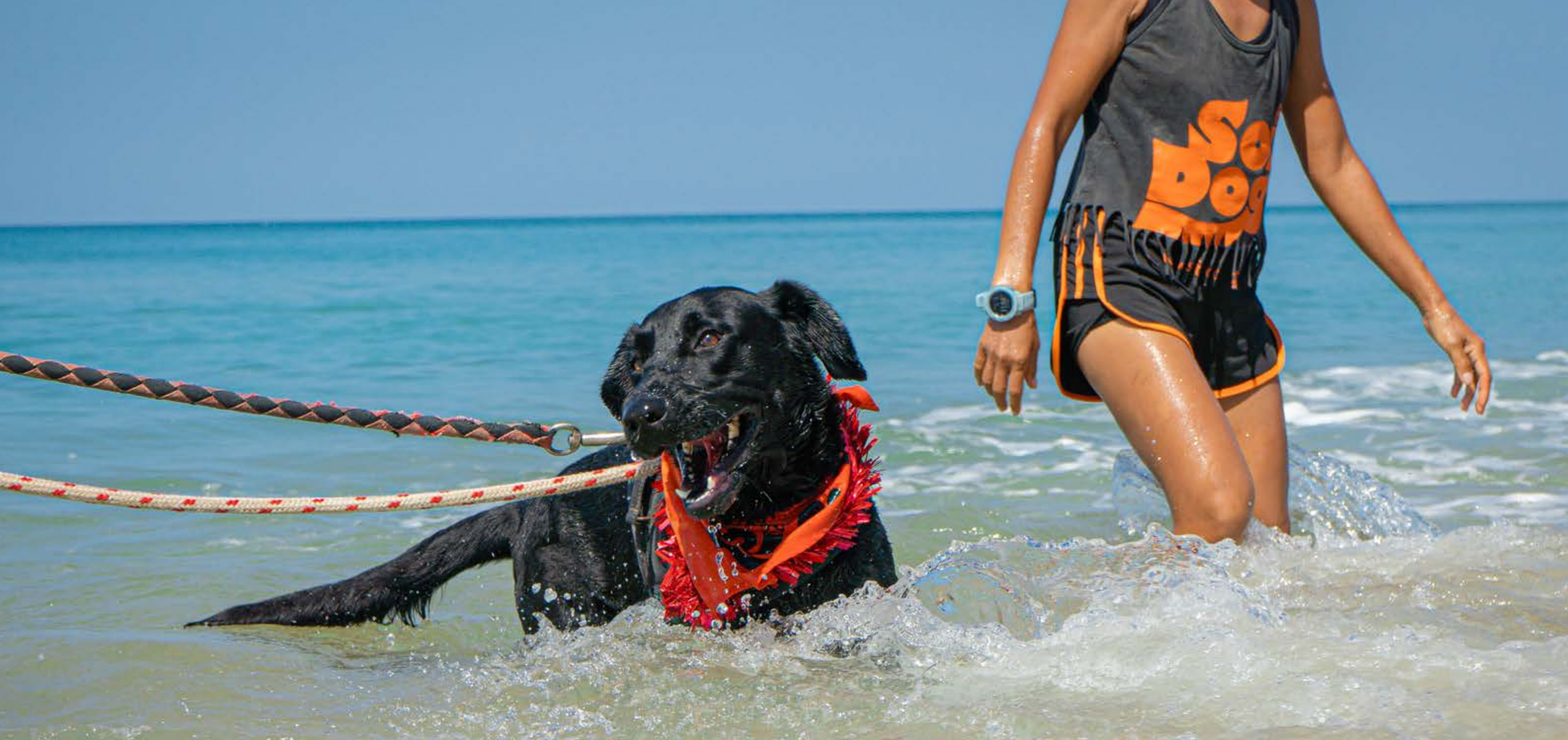
เจ้าแบล็คแพนเตอร์สนุกกับการทำน้ำสาดกระจาย

สุนัขที่โชคดีทั้งสิบตัวถูกใส่สายจูงและแต่งองค์ทรงเครื่องด้วยเสื้อผ้าสไตล์คริสต์มาสเพื่อให้เข้ากับบรรยากาศ มากกว่าครึ่งที่กำลังจะได้สัมผัสชีวิตนอกศูนย์พักพิงเป็นครั้งแรก และพวกมันก็ดูตื่นเต้นกันมาก สายหางไปมาและหูลู่ลมอย่างร่าเริง