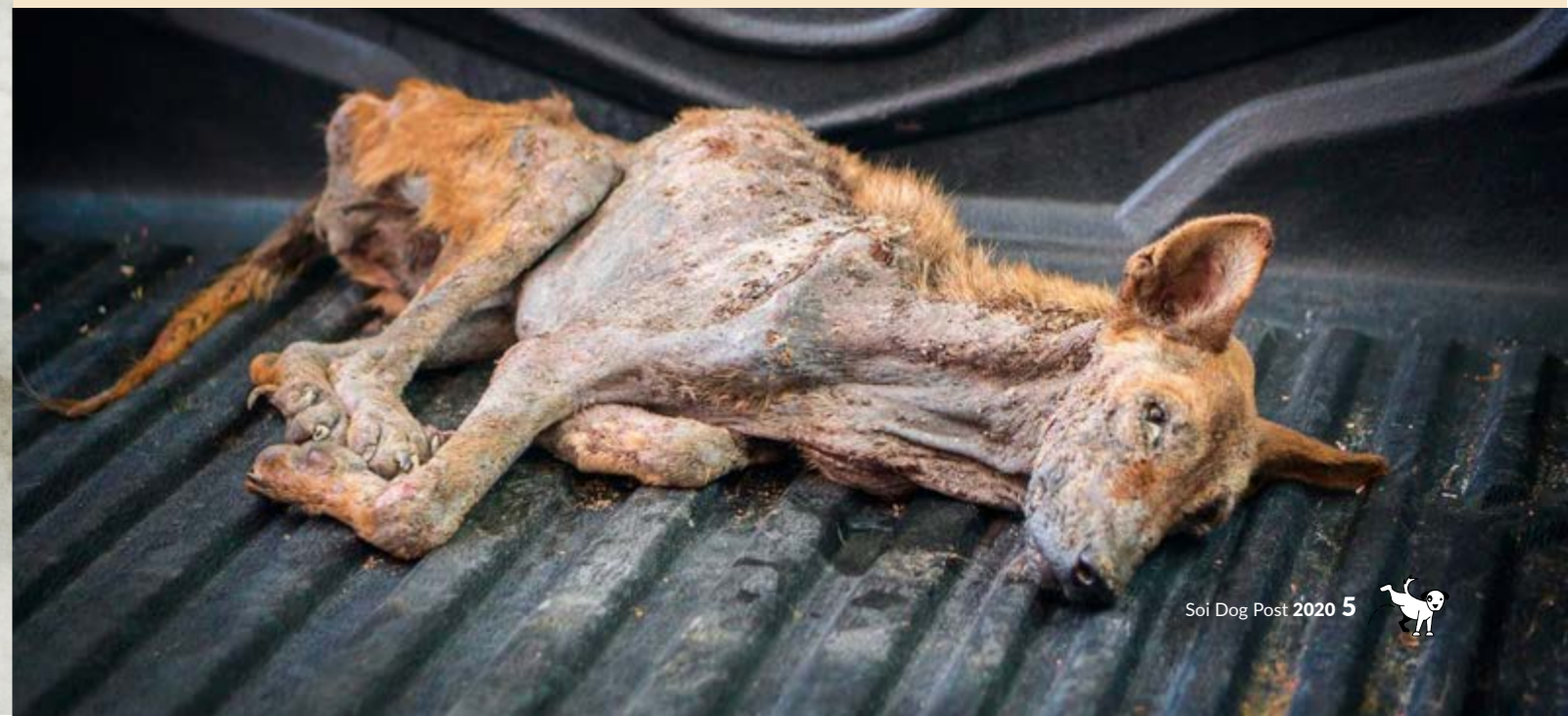
ป๊อบบี้เมื่อครั้งถูกนำตัวส่งมาที่ ซอยต๊อ กเมื่อเดือนเมษายน 2562

ดังนั้นเราจึงขอข้อมูลเพิ่มเติมในทันที โชคดีที่เราผ่านการคัดกรองและได้รับเลือก ซึ่งเราก็เลือกป๊อบบี้ (แน่นอนอยู่แล้ว) มีการสัมภาษณ์หลายครั้งในช่วงหลายสัปดาห์ซึ่งสำหรับเรารู้สึกเหมือนใช้เวลาทั้งชีวิตเลยทีเดียวเนื่องจากเขตเวลาที่แตกต่างกันระหว่างที่พวกเราอยู่และประเทศไทย พวกเราเคยผ่านขั้นตอนเหล่านี้มาแล้วครั้งหนึ่ง และก็เข้าใจการทำงานที่ต้องระมัดระวังและรัดกุมในการหาบ้านใหม่ให้แก่สุนัขของซอยต๊อ ก หลังจากนั้นพวกเราตั้งตารอคอยอาสาสมัครที่พาป๊อบบี้ขนส่งผ่านเครื่องบินมาที่แท็กซัส เราก็ไม่แน่ใจนักว่าใช้เวลานานแค่ไหนแต่ระหว่างที่รอก็ได้รับข้อความที่ทำให้พวกเราอุ่นใจเป็นอย่างมากจากผู้อำนวยความสะดวกเข้ามาถึงชุมชนจากซอยต๊อ กที่อเมริกา ไม่กี่วันก่อนวันครบรอบวันแต่งงานของฉันกับเบลค เธอได้ดูวิดีโอรำลึกถึงขวัญใจและรู้เรื่องราวของป๊อบบี้ และยื่นขอเสนอให้ฉันใช้ไมล์สะสมของเธอในการบินไปรับป๊อบบี้ด้วยตัวเอง ฉันตอบทันทีว่าสิ่งนี้มันมากเกินไปในการทำเพื่อฉัน แต่เธอก็พูดต่อมาในสิ่งที่ทำให้ฉันปฏิเสธไม่ได้เลย นั่นก็คือเธอแนะนำให้ฉันเป็นอาสาสมัครที่พาสุนัขขนส่งมาที่อเมริกาด้วยเลยในครั้งนี่ แล้วฉันจะบอกปัดได้อย่างไรกัน! นี่เป็นของขวัญวันครบรอบแต่งงานที่ดีที่สุดของเราทั้งคู่