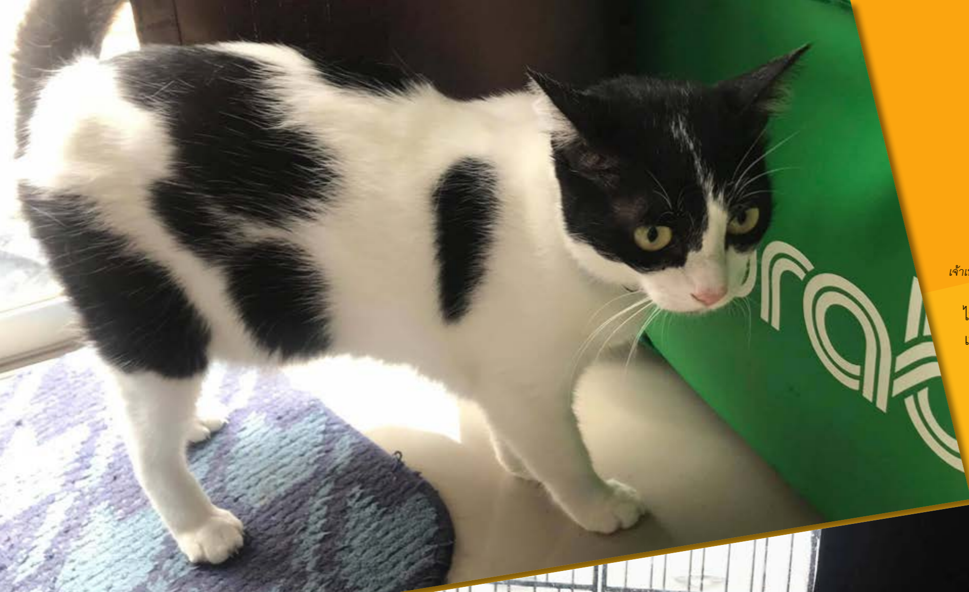
เจ้าเพิ่มโชคและเพิ่มทรัพย์ แมวที่คุณกับให้การช่วยเหลือไว้

ไม่ใช่เพียงแค่เธอจะรับอุปถัมภ์ลูกแมวด้วยตัวเอง เธอยังคอยมองหาคนที่พร้อมจะมาเป็นผู้อุปถัมภ์แบบเธอด้วยเช่นกัน และก็เป็นเรื่องที่ดีมากเพราะชอยด็อกนั้นปรารถนาให้บรรดาสัตว์ได้ไปอยู่กับคนในชุมชนมากขึ้นเนื่องจากพื้นที่ของศูนย์พักพิงที่จำกัด และเธอยังมักจะคอยสังเกตดูหากมีใครที่พาแมวมาเพื่อทำหมันก็มักจะเอ่ยปากชวนให้มาเป็นผู้อุปถัมภ์ด้วยกันและแถมทำยาชอยด็อกยีนดีที่จะช่วยเหลือในกรณีฉุกเฉินและยินดีตอบคำถามข้อสงสัยทุกอย่าง คุณกับมักจะเน้นย้ำเสมอว่าการอุปถัมภ์ไม่ใช่การรับเลี้ยงถาวร เมื่อแมวสุขภาพแข็งแรงก็ให้นำมาเพื่อทำหมัน และจากนั้นอาจจะอยู่ที่ศูนย์พักพิงหรือกลับไปยังสถานที่ที่เรารับมันมาหากว่าบริเวณนั้นมีผู้ดูแลสัตว์ในชุมชนอยู่